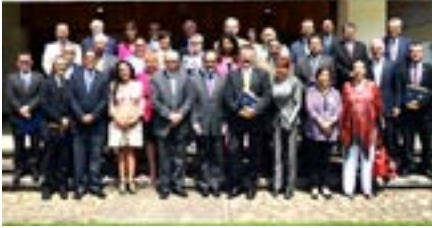
Testimonio de la reunión de trabajo de los Coordinadores de las Comisiones Técnicas Consultivas de la SEP en la Unidad de Seminarios «Ignacio Chávez» de la UNAM.