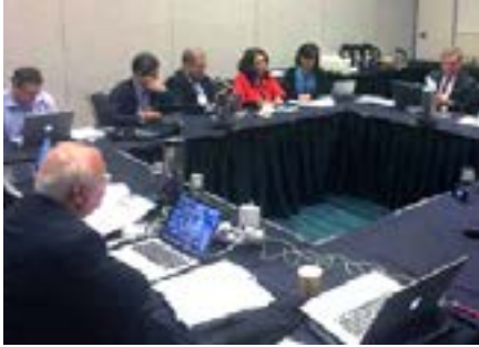
Un aspecto del proceso de certificación por la World Federation of Neurology.

leído en la neurología mundial. La visita inició con una exposición de cada una de las sedes formadoras de neurólogos en México, incluyendo la que se imparte con el apoyo y reconocimiento de la Facultad de Medicina de la Universidad Autónoma de San Luis Potosí en el Hospital Central “Dr. Ignacio Morones Prieto”.