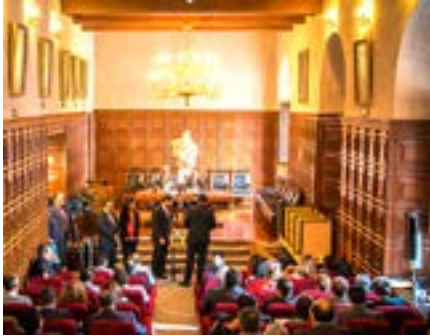
La Sala Manuel María de Gorriño y Arduengo fue testigo del sufragio de los Consejeros Universitarios para la elección del Rector y Directores.