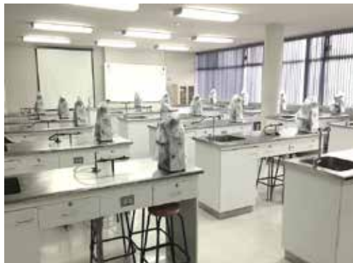
Así luce el Laboratorio de Microbiología hoy en día.